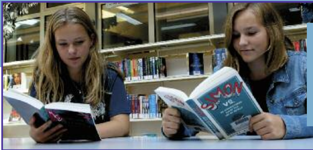
Leerlingen van de RSG Magister Alvinus in Sneek, winnaar van de Nationale Mediatheek Trofee 2017.

NATIONALE MEDIATHEEK TROFEE – Een inspirerende leesomgeving is van cruciaal belang voor het leesklimaat op school. Om scholen aan te zetten om te investeren in een aantrekkelijke mediatheek, reiken Stichting Lezen en Passionate Bulkboek de Nationale Mediatheek Trofee uit.