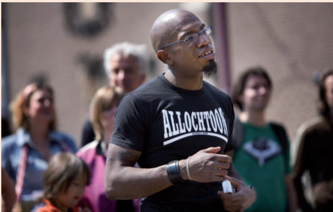
Het gezicht van kosmopool Nederland is de afgelopen decennia veranderd, de grote steden zijn van kleur verschoten.

Er zijn veel zaken die ons vermoeien in het huidige tijdsgewricht. Soms denk ik wel eens dat wat de politiek heeft gedaan met het onderwijs, of wat het onderwijs met zich heeft laten doen, heeft geleid tot een structurele vermoeidheid. Wat onder andere zo vermoeiend is, is de hype-cultuur. Dat