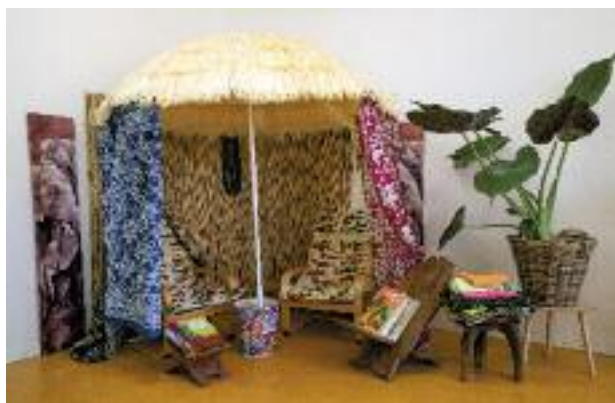
Leeshoekje op OBS Heidepark

Een andere opvallende uitkomst is dat lang niet alle basisscholen tevreden zijn over hun begrijpend- en technisch-lezenmethode. Voor technisch lezen maakt de meerderheid van de scholen gebruik van de methode Estafette ; slechts twee op de vijf leerkrachten vindt dat deze methode het leesplezier stimuleert. Voor begrijpend lezen zijn de resultaten iets beter.